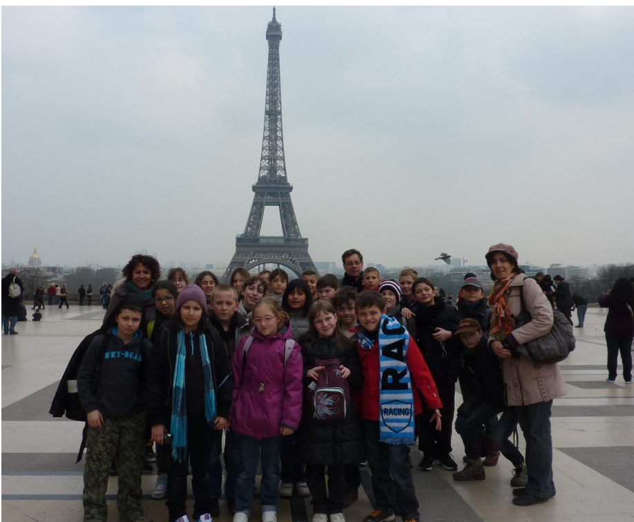
Photo souvenir avec dame Eiffel...