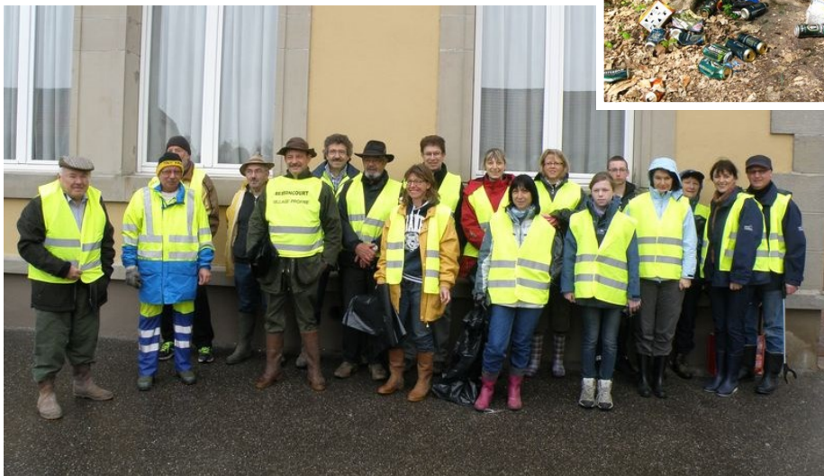
L'équipe de volontaires prête à arpenter les différents secteurs de la commune.