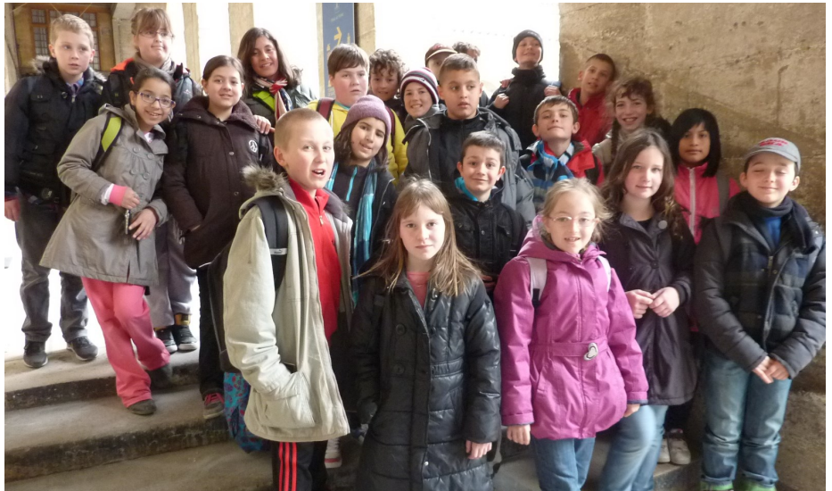
La découverte du musée des Invalides pour les élèves.

Le jeudi matin, nous avons pris le métro pour nous rendre au