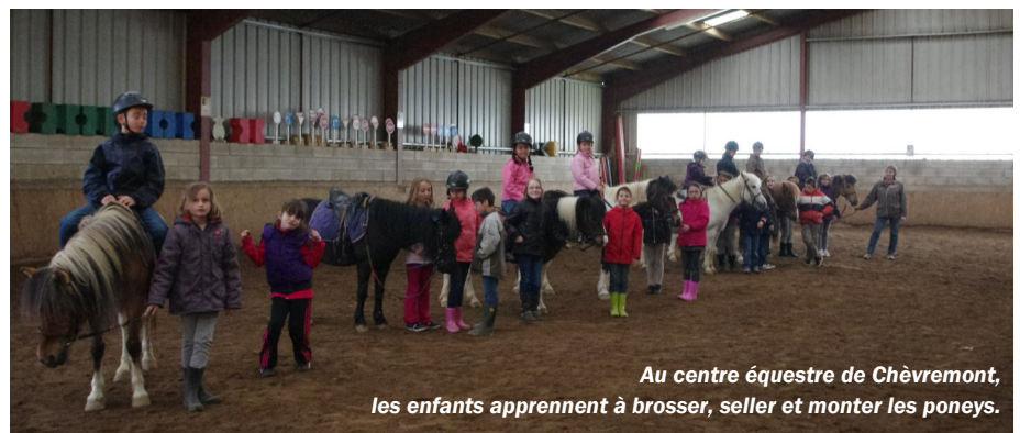
Au centre équestre de Chèvremont, les enfants apprennent à brosser, seller et monter les poneys.

D'abord, il faut brosser les poneys car ils sont allés dehors et se sont roulés dans la boue. Pour cela, nous utilisons différentes brosses : l'étrille, le bouchon puis la brosse douce. Puis nous curons les sabots avec un cure-pied. Il faut être très prudent afin d'éviter les coups de