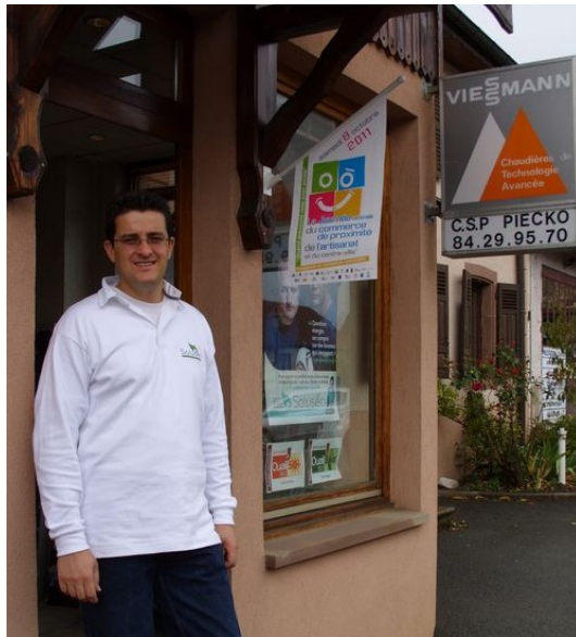
Les commerçants et artisans de la commune mobilisés pour l'opération « sourires du commerce »

Le public pouvait partir à « la chasse aux sourires » en se rendant dans chaque commerce partenaire pour y découvrir de nombreux lots et participer au tirage au sort final. Le gros lot étant un vélo électrique.