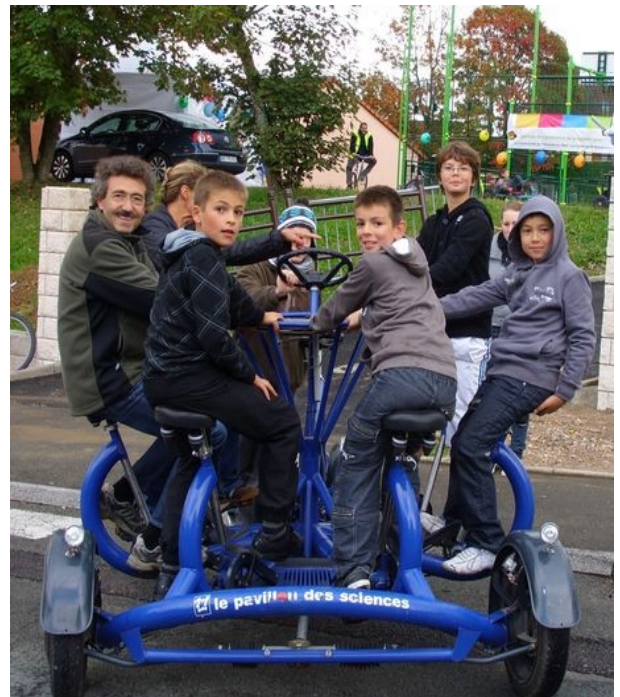
Durant la journée, Les navettes relient les deux points d'animation grâce à un vélo conférence