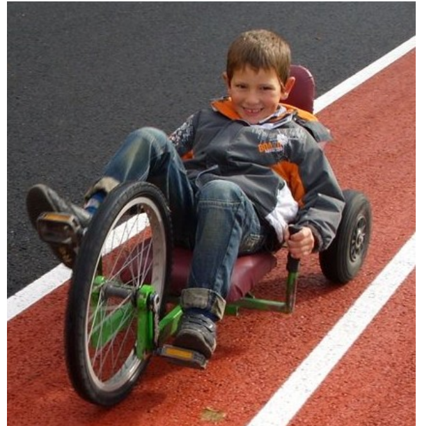
Les « vélos fous » ont eu beaucoup de succès. On pouvait pédaler assis ou couché, en travers ou à l'envers...